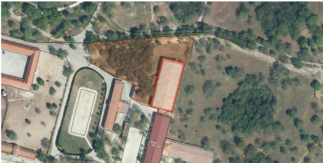
Slika 1: Posnetek obstoječega stanja z označenim objektom, ki ima vgrajeno azbestno cementno kritino (iObcina)

Investitor bo izvedel poseg na območju parc. št. 1899/72, 1899/116, k.o. 2458 BAZOVICA. Iz objekta bo odstranil azbestno cementno kritino (slika 1).