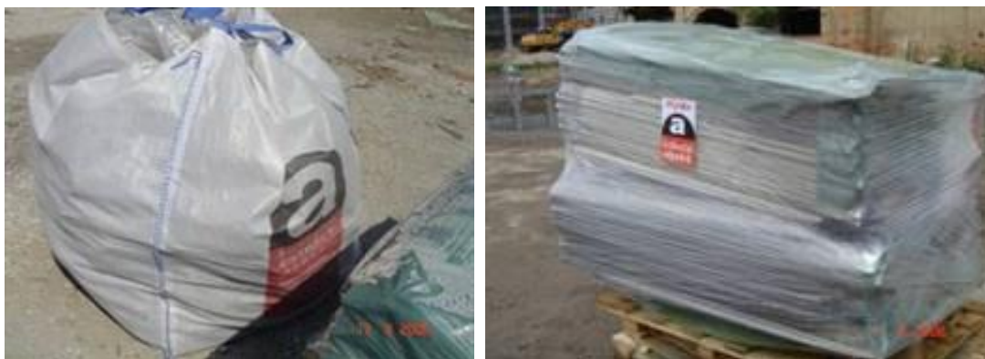
Slika 3: Primer ustreznega ravnanja z odpadki