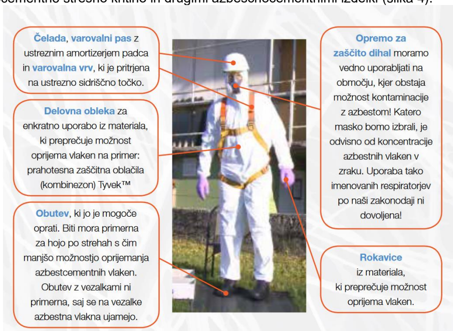
Slika 4: Osebna varovalna oprema za delo z azbest-cementnimi izdelki

Poleg osebne varovalne opreme za zaščito dihal se uporablja tudi druga varovalna oprema, opisana v izjavi o varnosti z oceno tveganja, ki jo sprejme delodajalec, ki odstranjuje azbestno kritino in jo tukaj posebej podrobno ne opisujemo. Povzemamo po publikaciji Varno delo z azbestnocementno strešno kritino in drugimi azbestnocementnimi izdelki (slika 4).