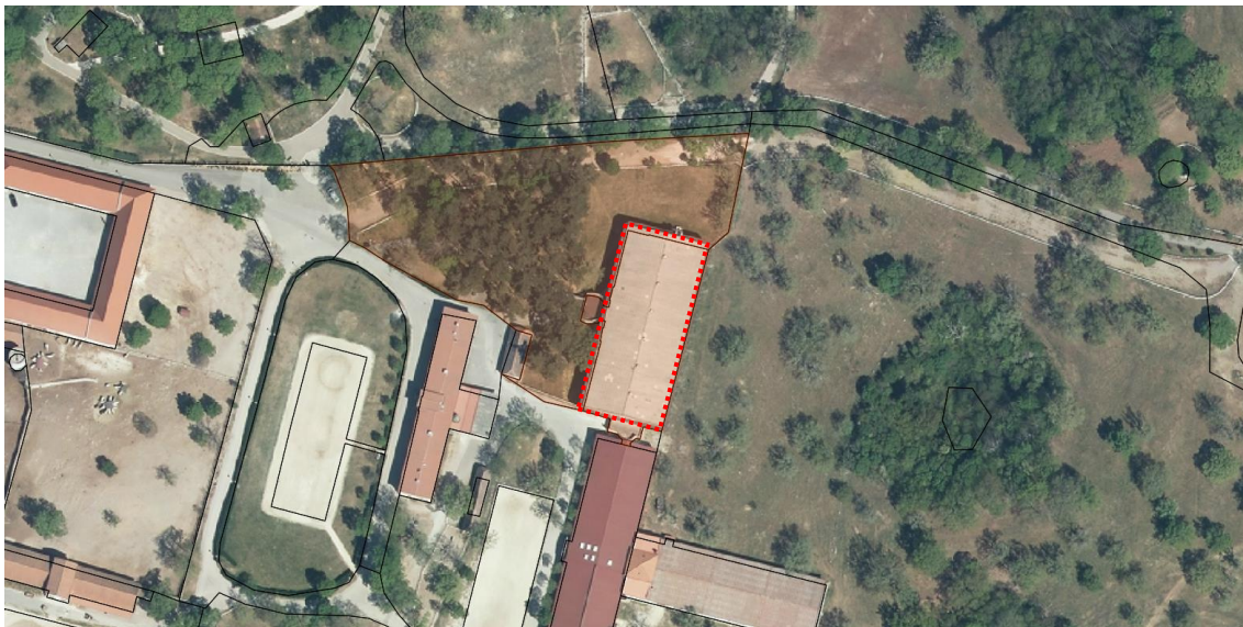
Slika 1: Posnetek obstoječega stanja z označenim objektom, ki ima vgrajeno azbestno cementno kritino (iObcina)

Investitor bo izvedel poseg na območju parc. št. 1899/72, 1899/116, k.o. 2458 BAZOVICA. Iz objekta bo odstranil azbestno cementno kritino (slika 1).