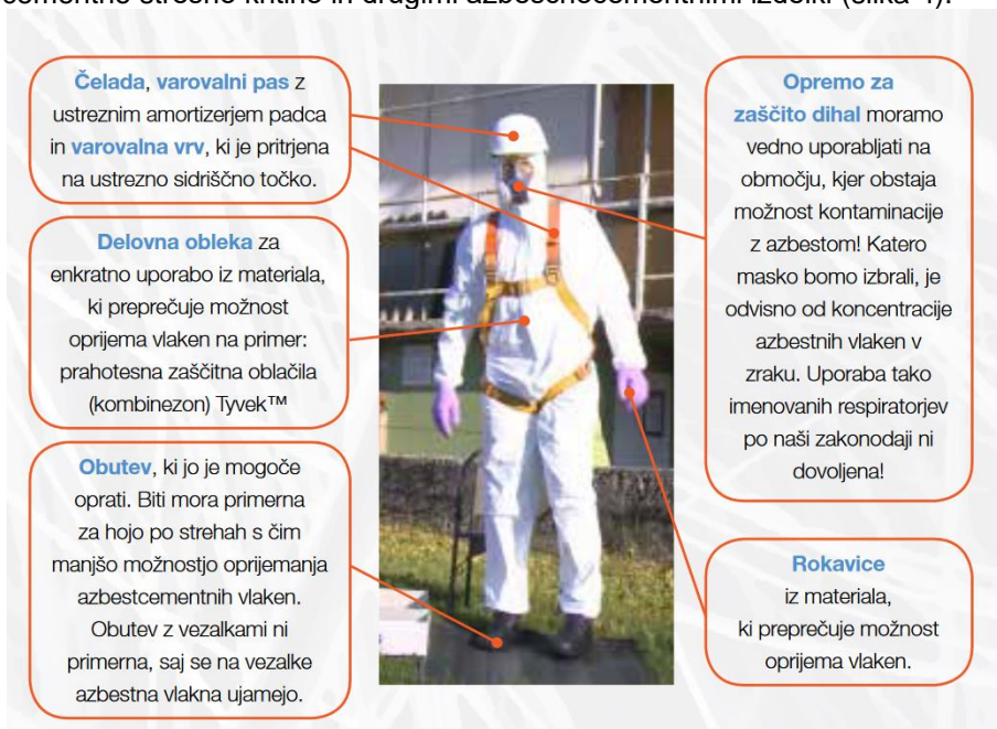
Slika 4: Osebna varovalna oprema za delo z azbest-cementnimi izdelki

Poleg osebne varovalne opreme za zaščito dihal se uporablja tudi druga varovalna oprema, opisana v izjavi o varnosti z oceno tveganja, ki jo sprejme delodajalec, ki odstranjuje azbestno kritino in jo tukaj posebej podrobno ne opisujemo. Povzemamo po publikaciji Varno delo z azbestnocementno strešno kritino in drugimi azbestnocementnimi izdelki (slika 4).